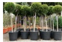
CUBETAS, CONTENEDORES Y MACETEROS MADERA